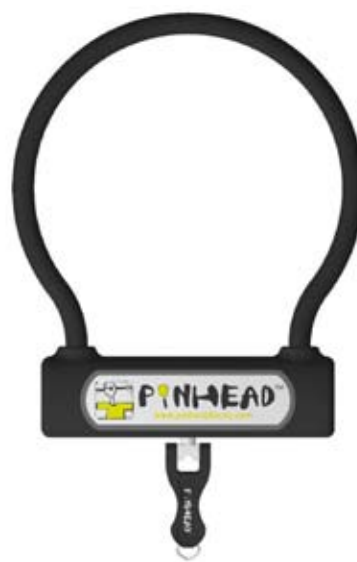
Bubble-Lock - Rahmen-Schutz