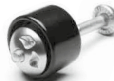
Schutz für Sattelstütze