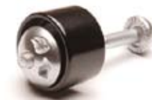
Schutz für Sattelstütze