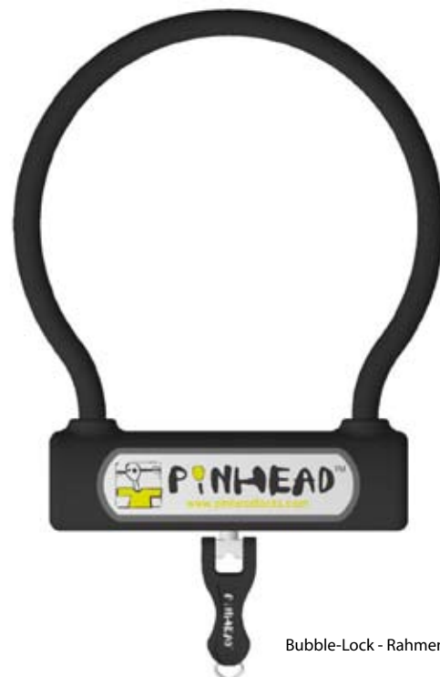
Bubble-Lock - Rahmen-Schutz